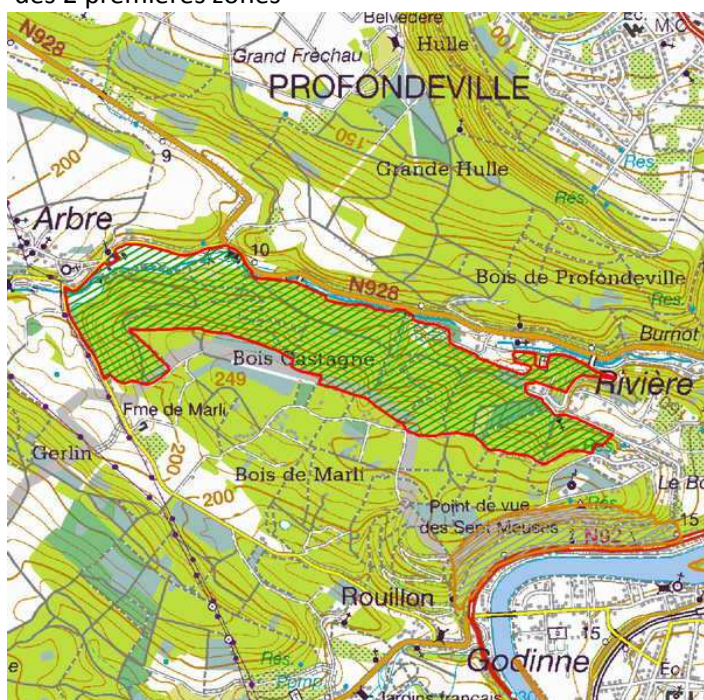
Zone Natura 2000 du Burnot : 137 ha

Sur Profondeville , la Région wallonne a défini 3 zones reprises en NATURA 2000 : la zone du Burnot, la zone du bord droit de Meuse et du Tailfer et la zone des Tiennes de Rouillon à Rivière. Ci-dessous la cartographie des 2 premières zones