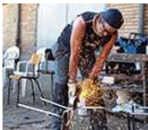
Un centre de tri innovant