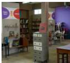
Un magasin de seconde main