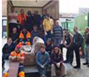
Une équipe dynamique

La RESSOURCERIE NAMUROISE collecte actuellement les déchets encombrants sur tout le territoire de la ville de Namur et sur celui de plusieurs communes proches de Namur.