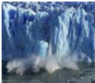
Une préoccupation environnementale