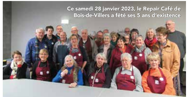
Ce samedi 28 janvier 2023, le Repair Café de Bois-de-Villers a fêté ses 5 ans d'existence