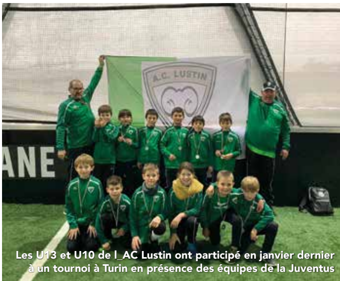
Les U13 et U10 de l'AC Lustin ont participé en janvier dernier à un tournoi à Turin en présence des équipes de la Juventus