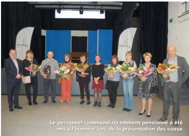
Le personnel communal récemment pensionné a été mis à l'honneur lors de la présentation des voeux