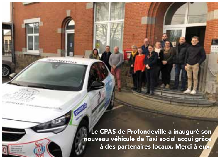
Le CPAS de Profondeville a inauguré son nouveau véhicule de Taxi social acquis grâce à des partenaires locaux. Merci à eux.