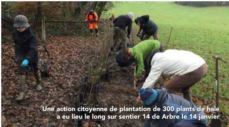
Une action citoyenne de plantation de 300 plants de haie a eu lieu le long sur sentier 14 de Arbre le 14 janvier