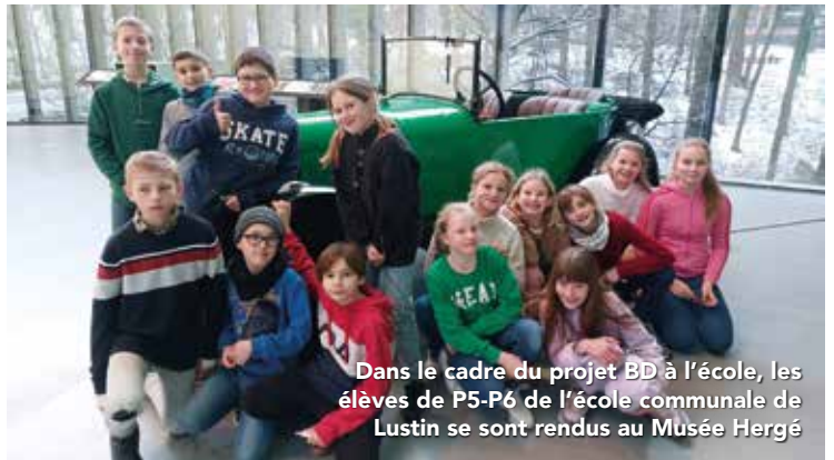
Dans le cadre du projet BD à l'école, les élèves de P5-P6 de l'école communale de Lustin se sont rendus au Musée Hergé