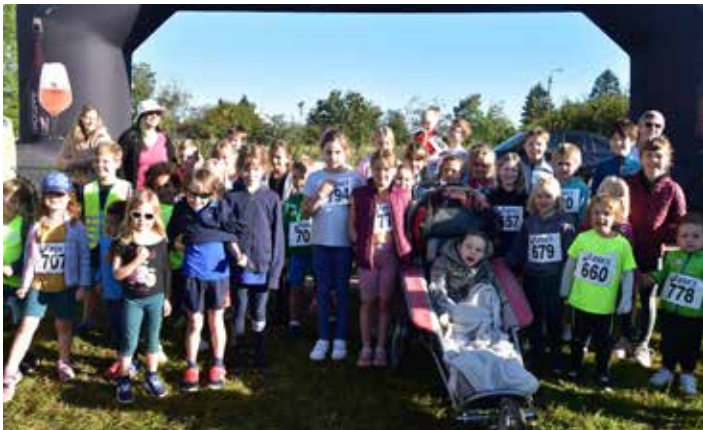
Lili Run à Lesve