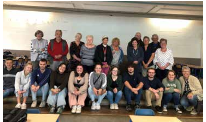
Coaching smartphone, ordi et gsm. Organisé dans le cadre des activités intergénérationnelles à l'école de Profondeville