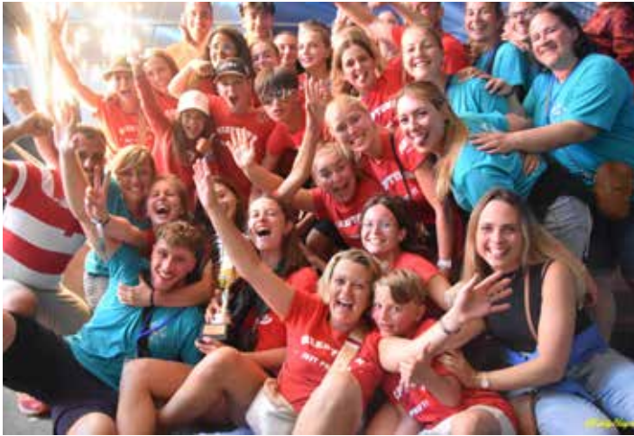
Profondeville remporte le Méga défi 2023