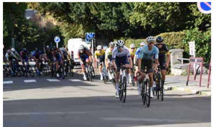
La flèche mosane Profondeville