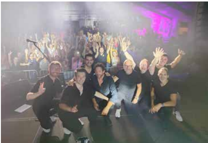
Kermesse de Bois-de-Villers