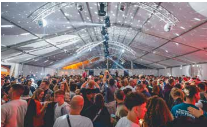
Kermesse de Profondeville