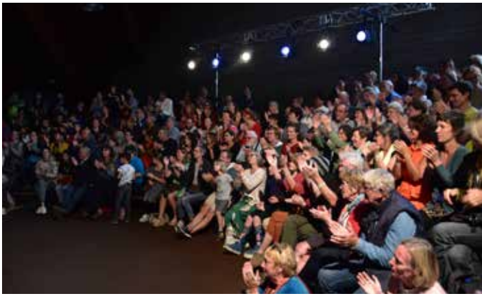
Festival Découvrez-vous à Bois-de-Villers