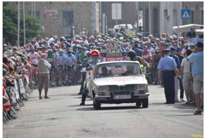
Vielle boucle lustinoise