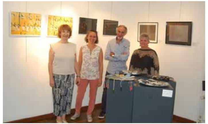
Exposition de Calligraphie à Arbre