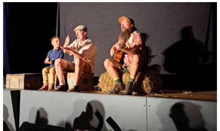
Journée Atout Jeunes du 27 septembre