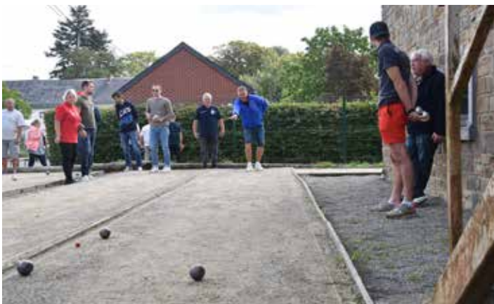
Tournoi des pétanqueurs de Lesve