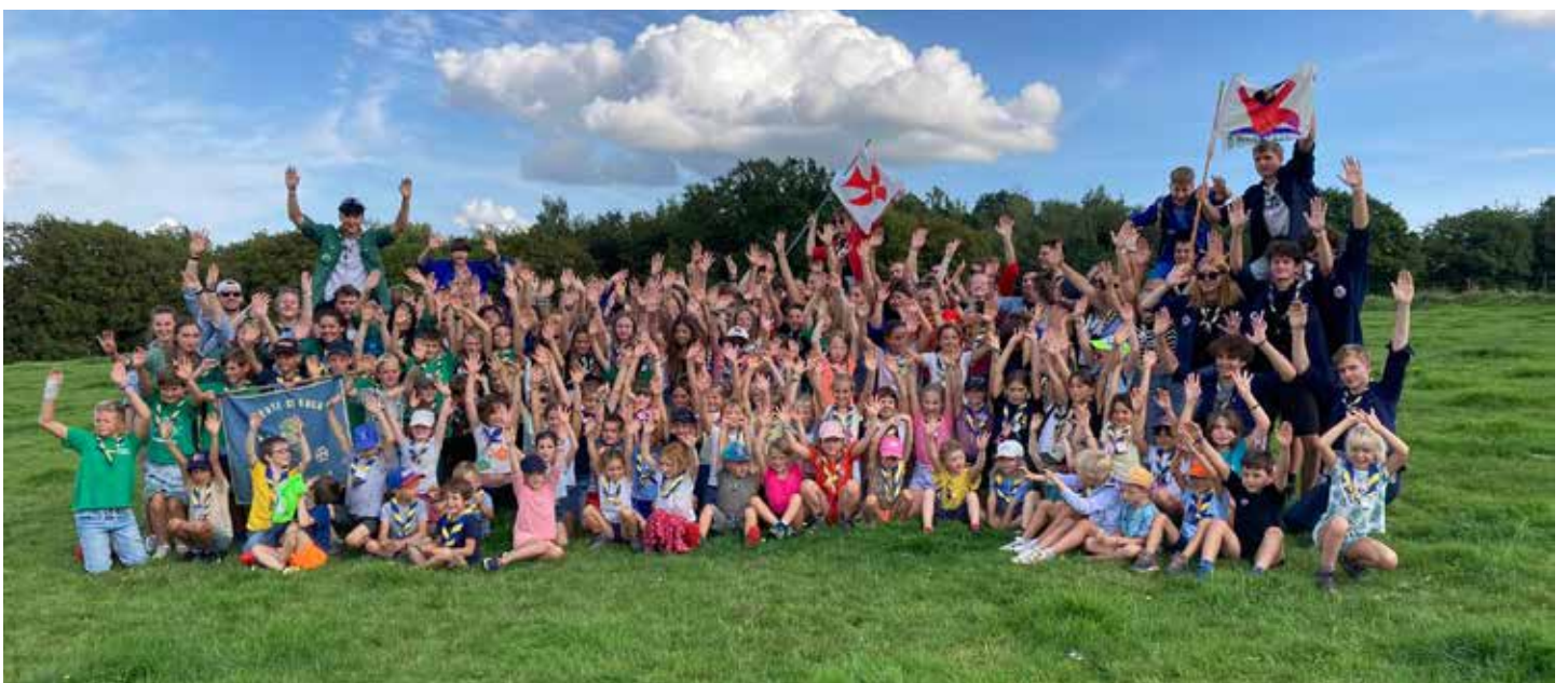
Fête de l'Unité scout de Bois-de-Villers