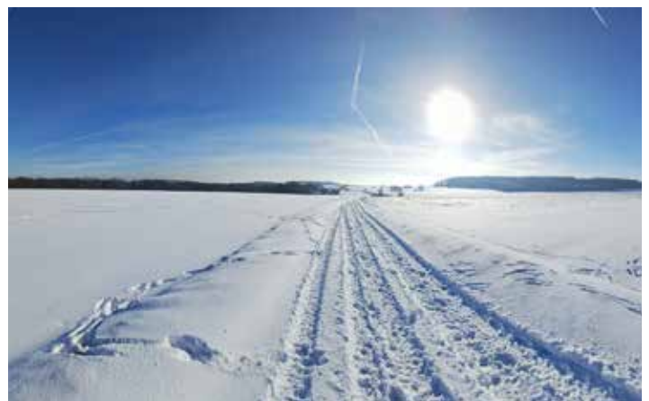
Neige de janvier à Lesve