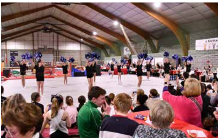
Soirée explogym à Profondeville