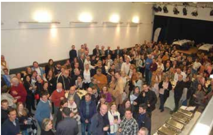
Voeux du Bourgmestre au personnel communal et CPAS