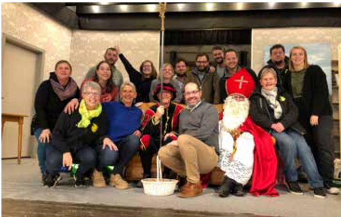
Saint Nicolas du Comite d'animation APPLE BDV