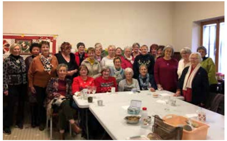
Goûter de Noël de l'équipe travaux d'aiguilles à Lesve