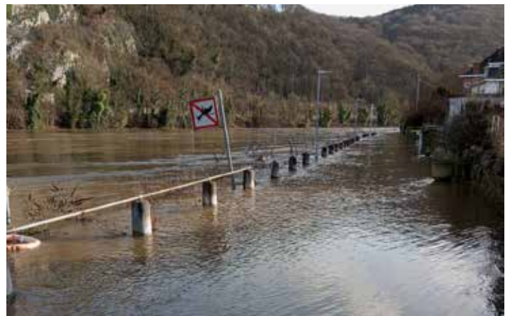
Inondations de ce début d'année 2024