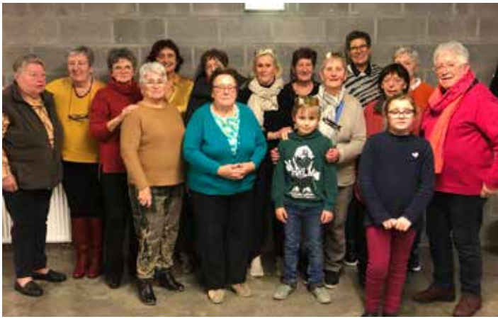
Fête des rois pour les 3x20 de Bois-de-Villers