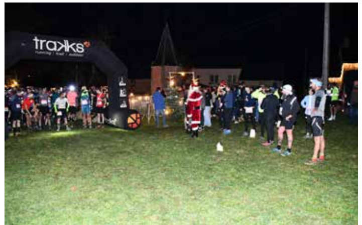
Corrid'arbre 16 décembre 2023